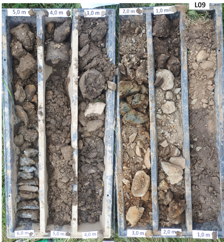
Obrázek 1: výnos jádra vrtu L09 - typická skladba sedimentů v severní části lokality (nivní sedimentace)