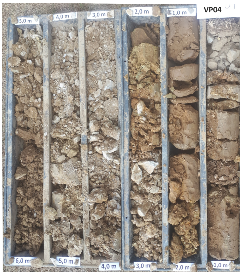
Obrázek 2: výnos jádra vrtu VP04 - skladba sedimentů v jižní části lokality (převažují svahoviny)