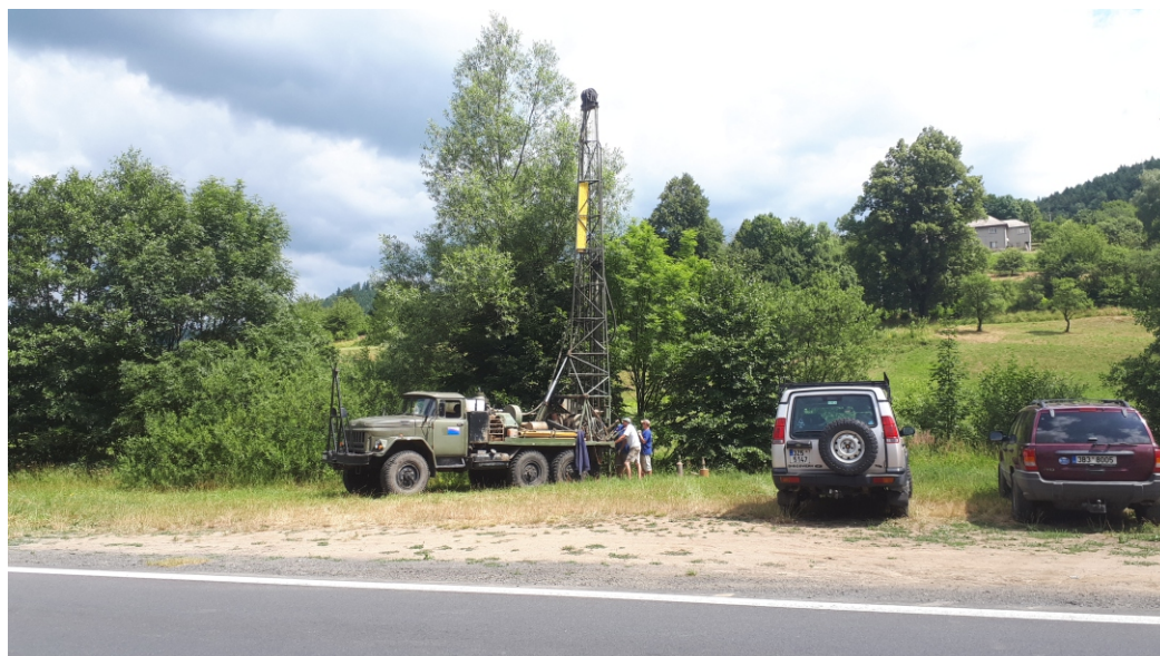
Obrázek 4: hloubení sondy L08